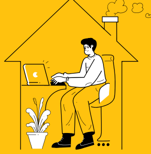
Education Software (LMS)