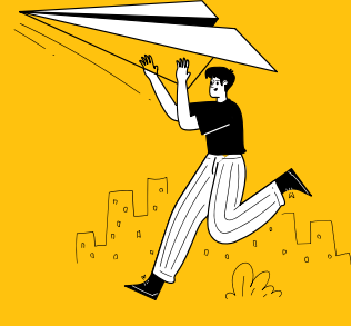
Implementation and Consulting